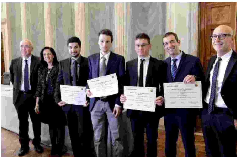
I dottori di ricerca che hanno ricevuto le borse di studio del Fondo Giancesini