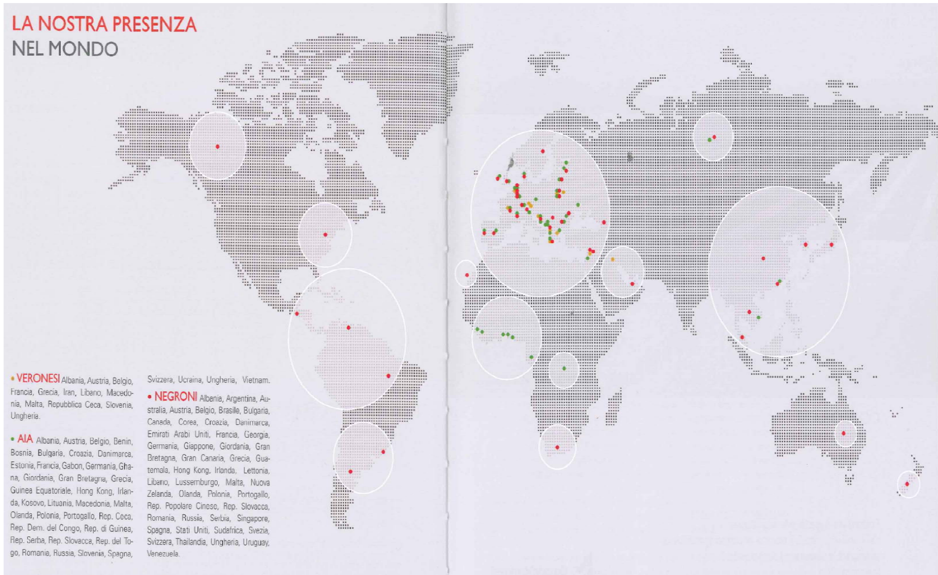
Figura 4: La presenza internazionale del Gruppo Veronesi: i mercati di sbocco