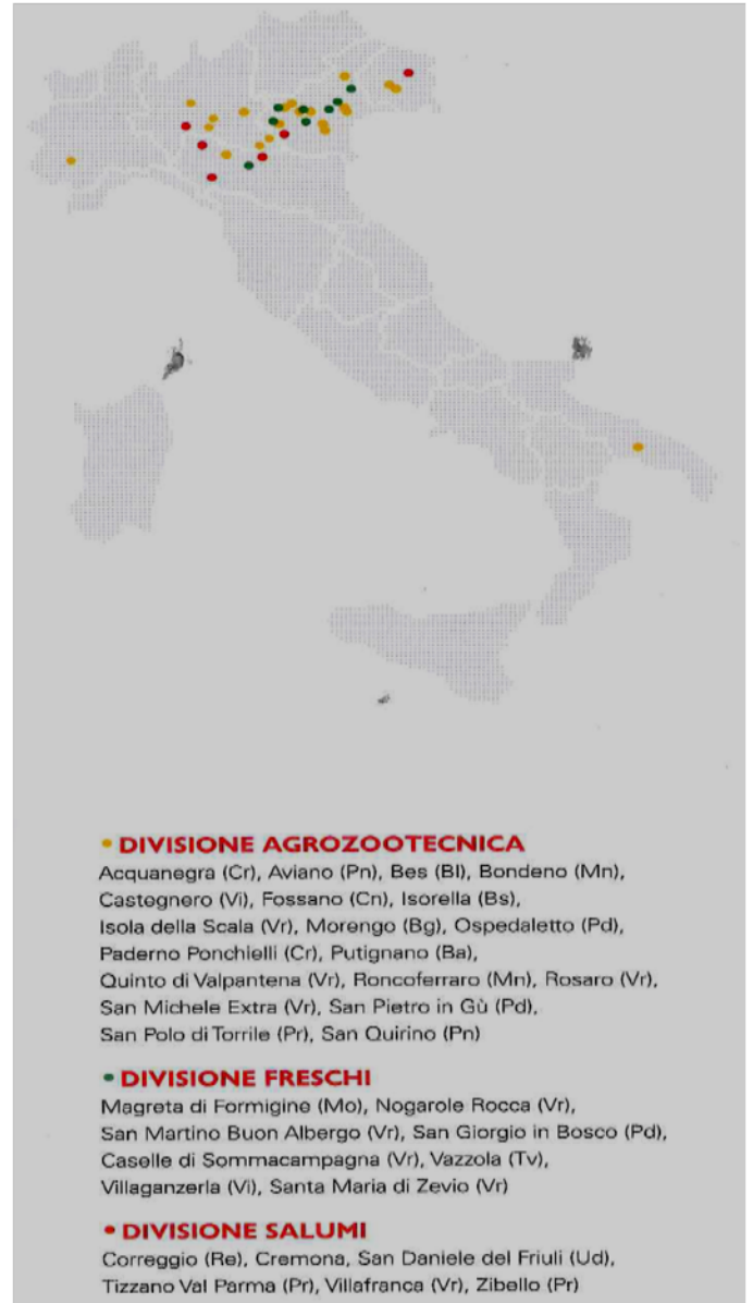
Figura 2: Le sedi produttive del Gruppo